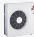
MUZ-EF 25/35/42 VE MUZ-EF 50 VE