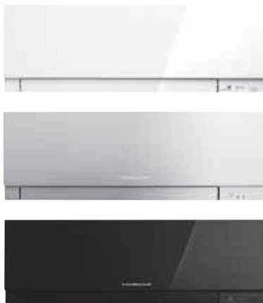
notranje enote povezljive z enojnimi in multi sistemi