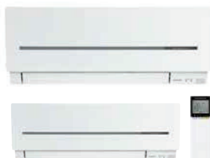
notranje enote povezljive z enojnimi in multi sistemi